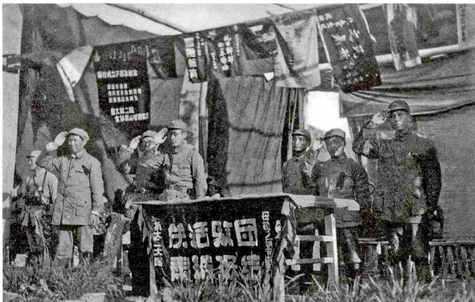
1939年6月1日，抗大在延安南门外举行建校三周年纪念大会。毛泽东、刘少奇等在会上检阅学员队伍