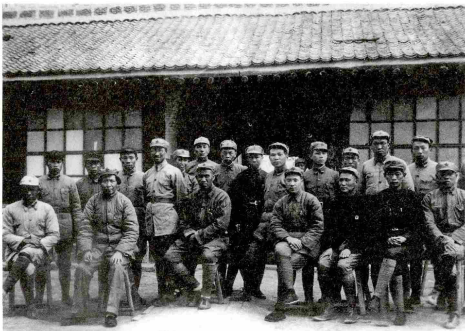
1937年春,毛泽东、朱德、林彪等和抗大部分人员合影

的讲话中,进一步阐述了坚定正确的政治方向的重要性。他指出:在抗大应当学习什么?首先是学一个政治方向。政治方向可以有许多不同的方向,你们要学一个正确的政治方向,这就是要打日本、怎样打日本、为什么日本帝国主义一定能被我们打倒的正确政治方向。